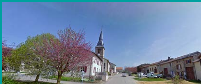
Photomontage de l'enfouissement des réseaux, Grande Rue à Athienville