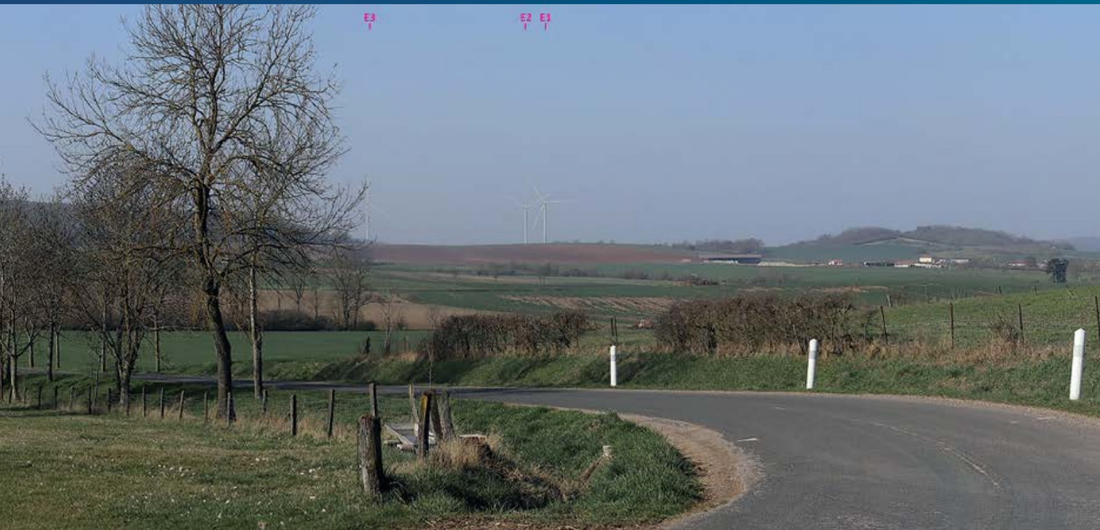
Photomontage depuis la D23, à hauteur de la ferme de la Quittaine, sur la commune d'Arracourt. (bureau d'études INDDIGO)